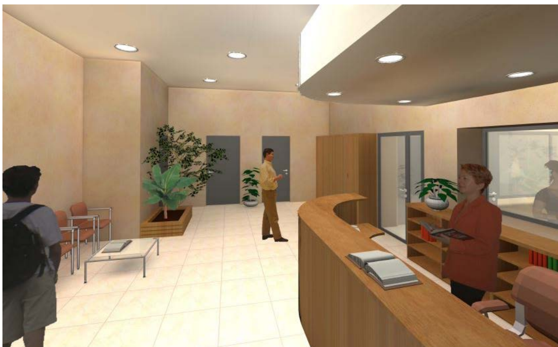
Vue d'artiste du futur accueil de la Mairie de Saint-Étienne du Grès