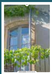
07 les fenêtres