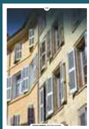
08 les volets