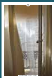
15 le confort thermique

Chaque intervention sur les façades de nos centres anciens compte et participe à l'harmonie du paysage urbain. Au cœur de nos villes et villages, l'intérêt particulier et l'intérêt général doivent être conjugués pour créer le cadre de vie que nous y recherchons tous.