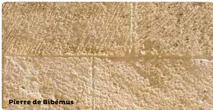
Pierre de Bibémus