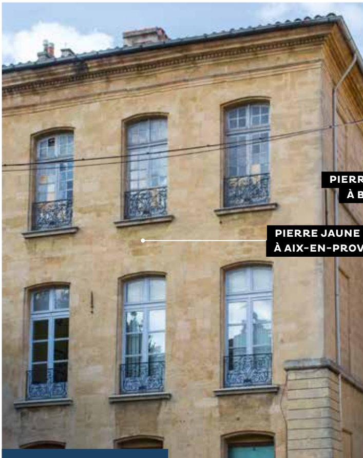
PIERRE BLANCHE À BOULBON