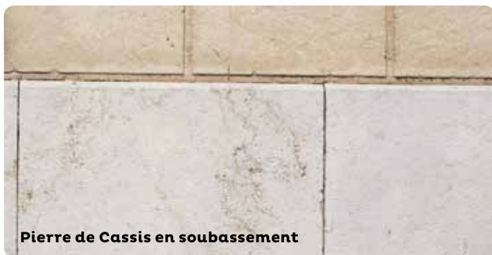
Pierre de Cassis en soubassement

capillarité dans les murs, les dépôts blanchâtres de salpêtre peuvent être retirés au moyen de compresses d'argile et de cellulose.