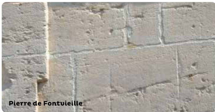
Pierre de Fontvieille